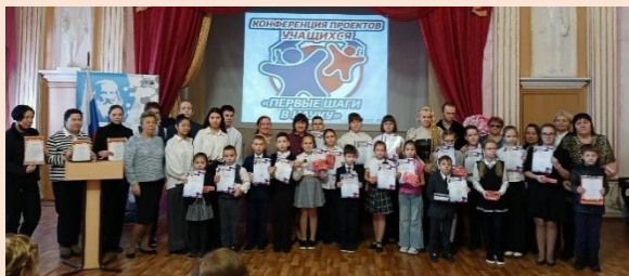
ШНПК 2024-2025 учебный год