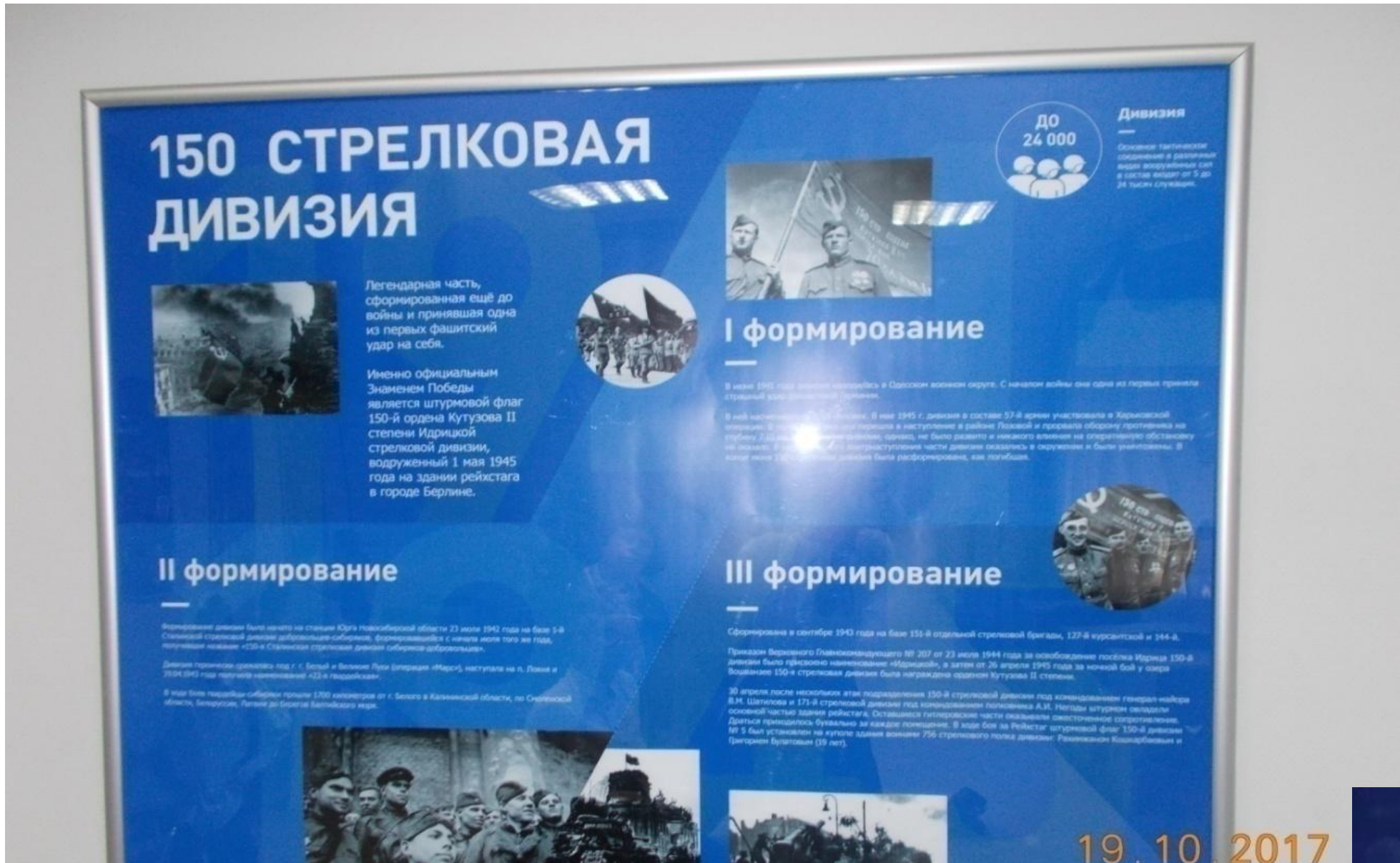
Стенд в Музее школы №7 г. Тюмени.