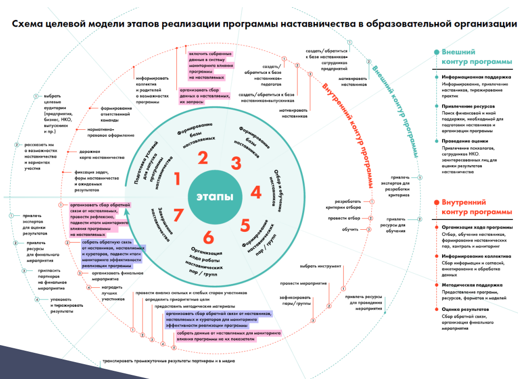
Схема целевой модели этапов реализации программы наставничества в образовательной организации

Одним из ключевых направлений создания системы является: развитие наставничества педагогических кадров, являющееся эффективным инструментом профессионального роста педагогических работников