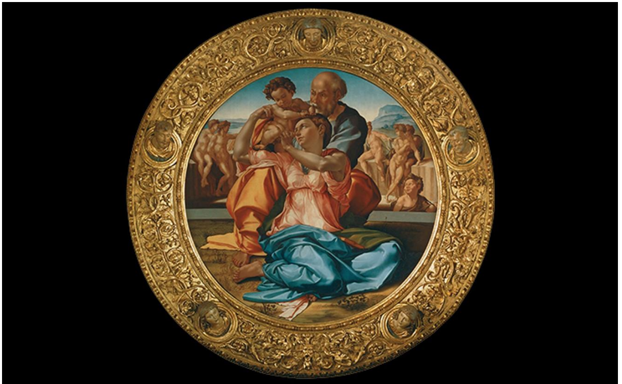
Святое семейство (1504 год)

Будь чист огонь, будь милосерден дух, Будь одинаков жребий двух влюбленных, Будь равен гнет судеб неблагоприятных, Будь равносильно мужество у двух. Будь на одних крылах в небесный круг Восхищена душа двух тел плененных, Будь пронзено двух грудей воспаленных Единою стрелою сердце вдруг, Будь каждый каждому такой опорой, Чтоб, избавляя друга от обуз, К одной мечте идти двойною волей, Будь тьмы соблазнов только сотой долей Вот этих верных и любовных уз,- Ужель разрушить их случайной ссорой?