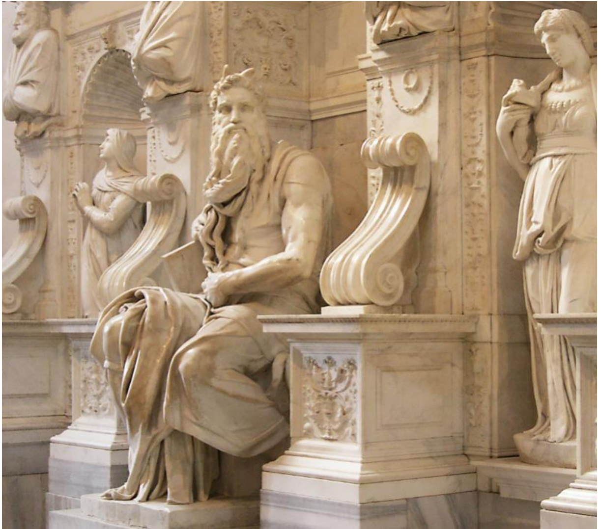
Моисей (1513-1515 гг.)