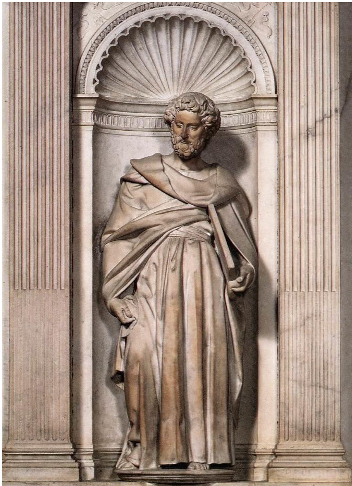
Статуя святого Петра выполнена скульптором готической эпохи (1245-1302 гг.)