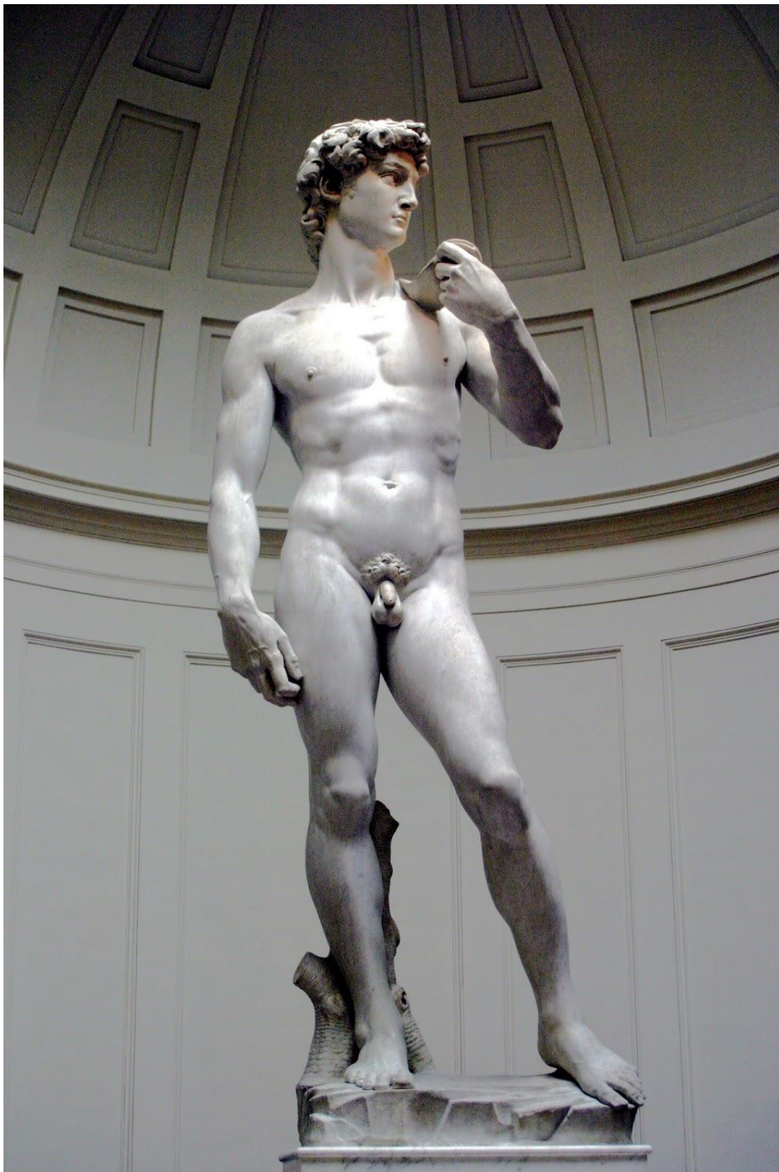
Давид (1504 год)