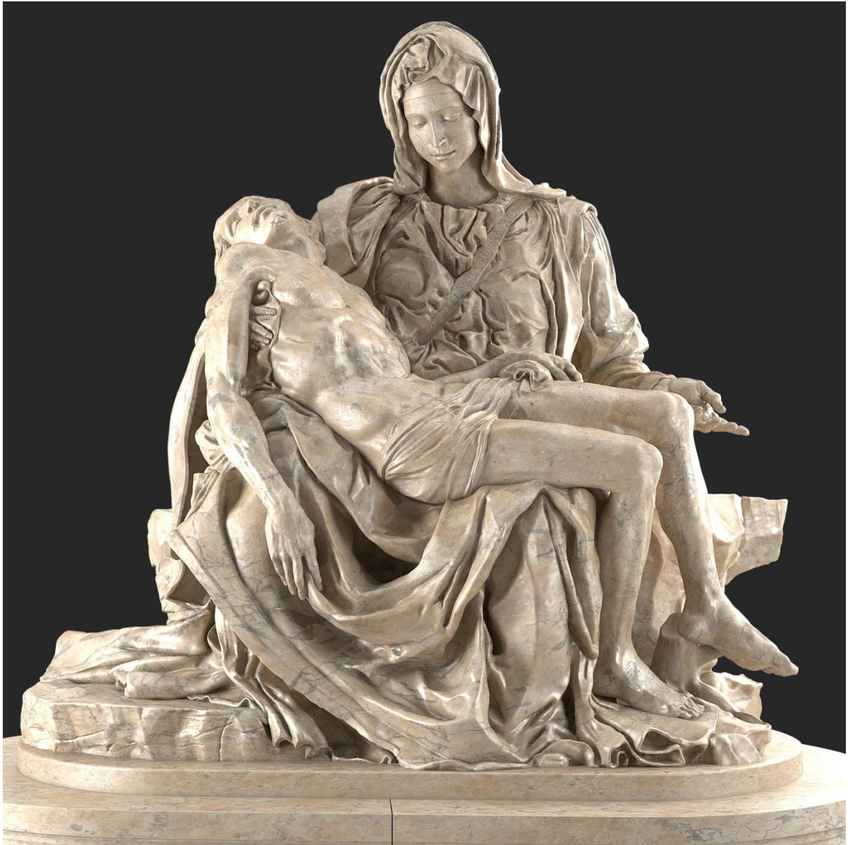
Оплакивание Христа, или Пьета (~1498-1500)