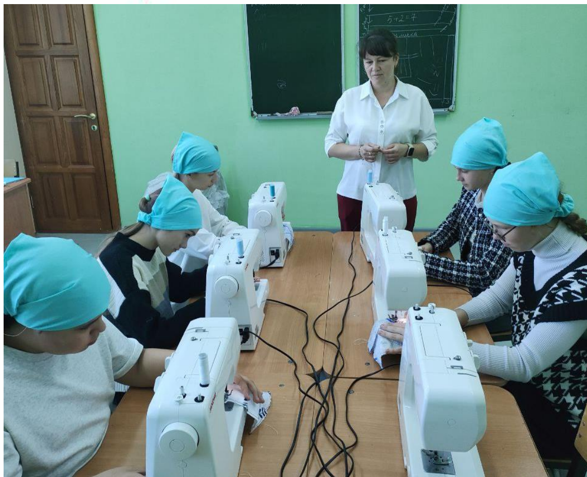
КРУЖОК «УМЕЛЫЕ РУЧКИ»