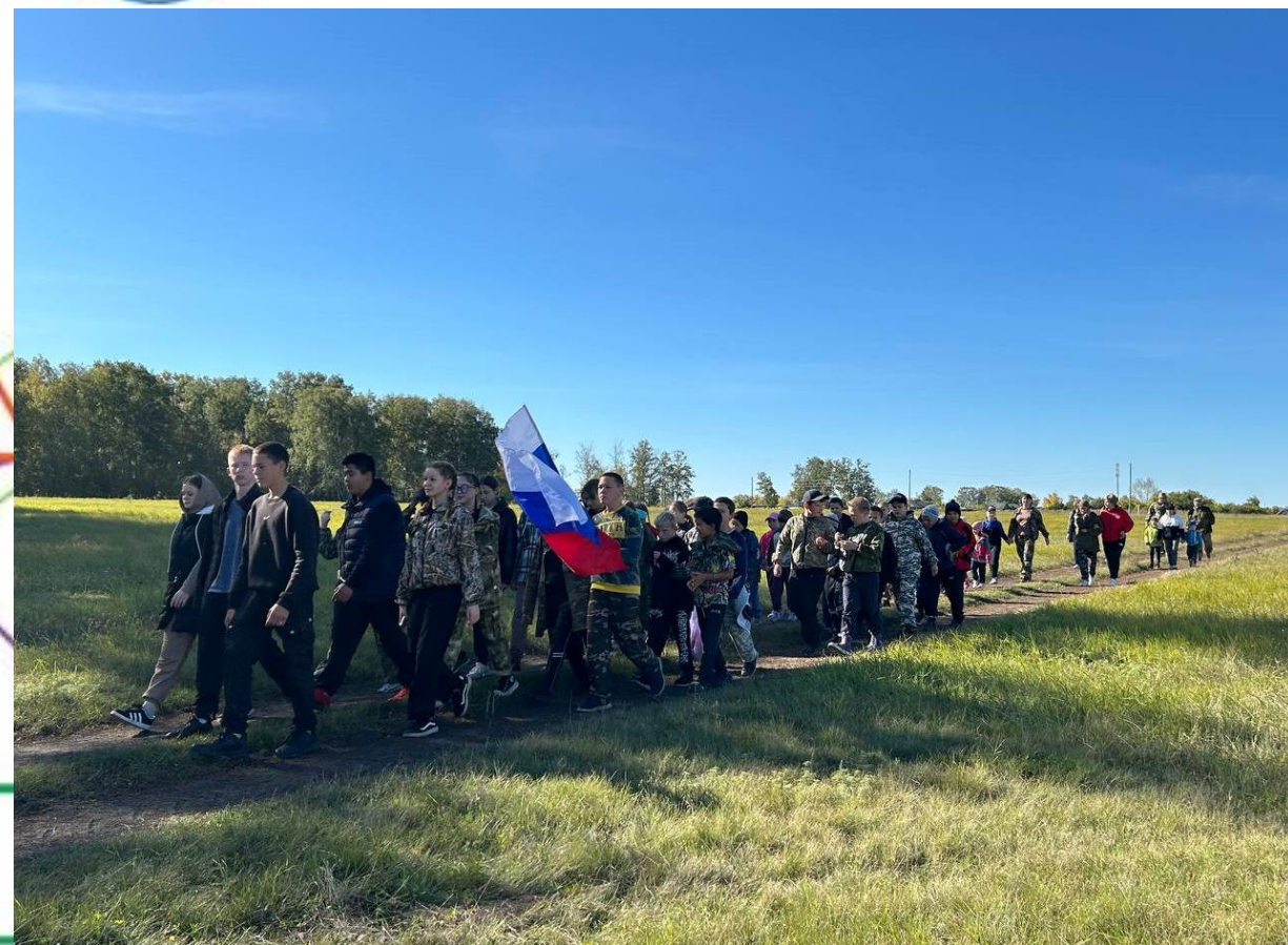
ТУРПОХОД «ПО ТРОПЕ ГЕРОЕВ»