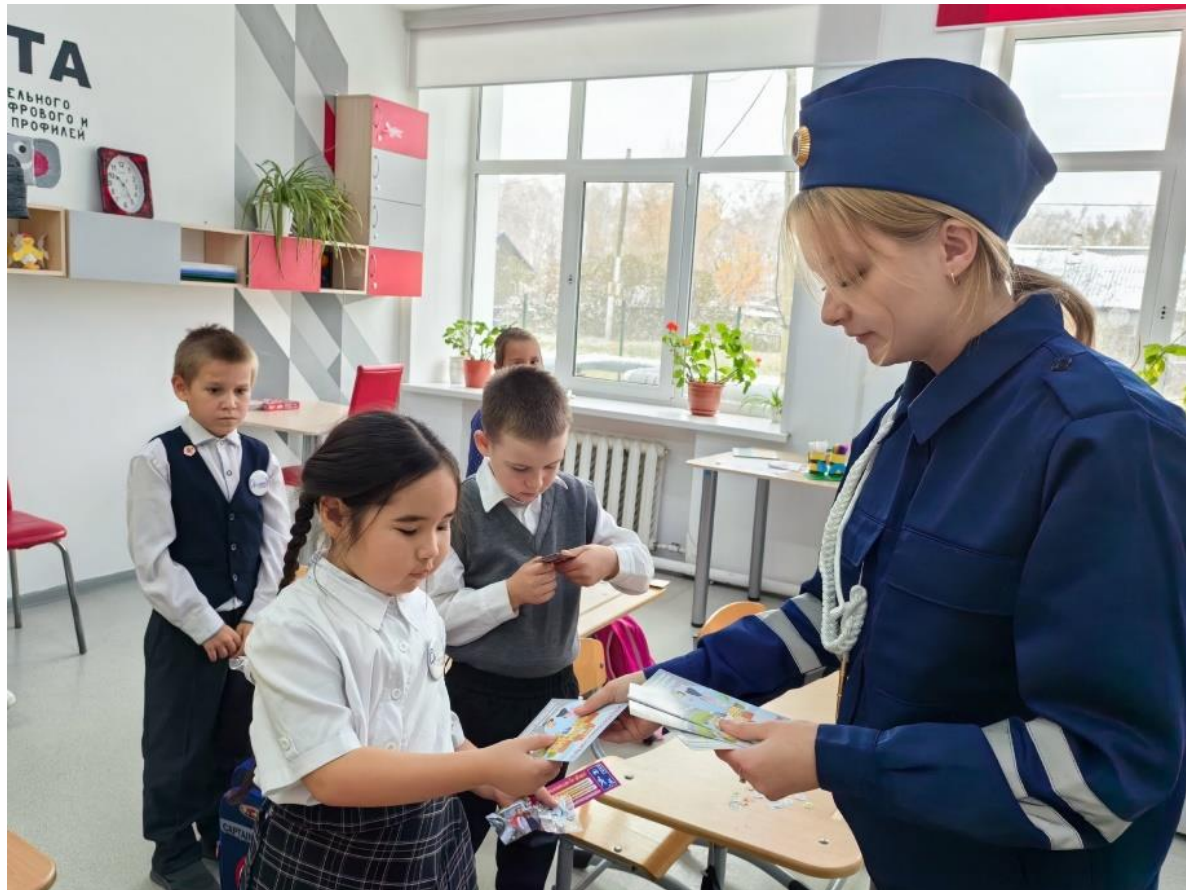
ДЕТСКОЕ ОБЪЕДИНЕНИЕ ЮИД «ДОРОЖНЫЙ ПАТРУЛЬ»