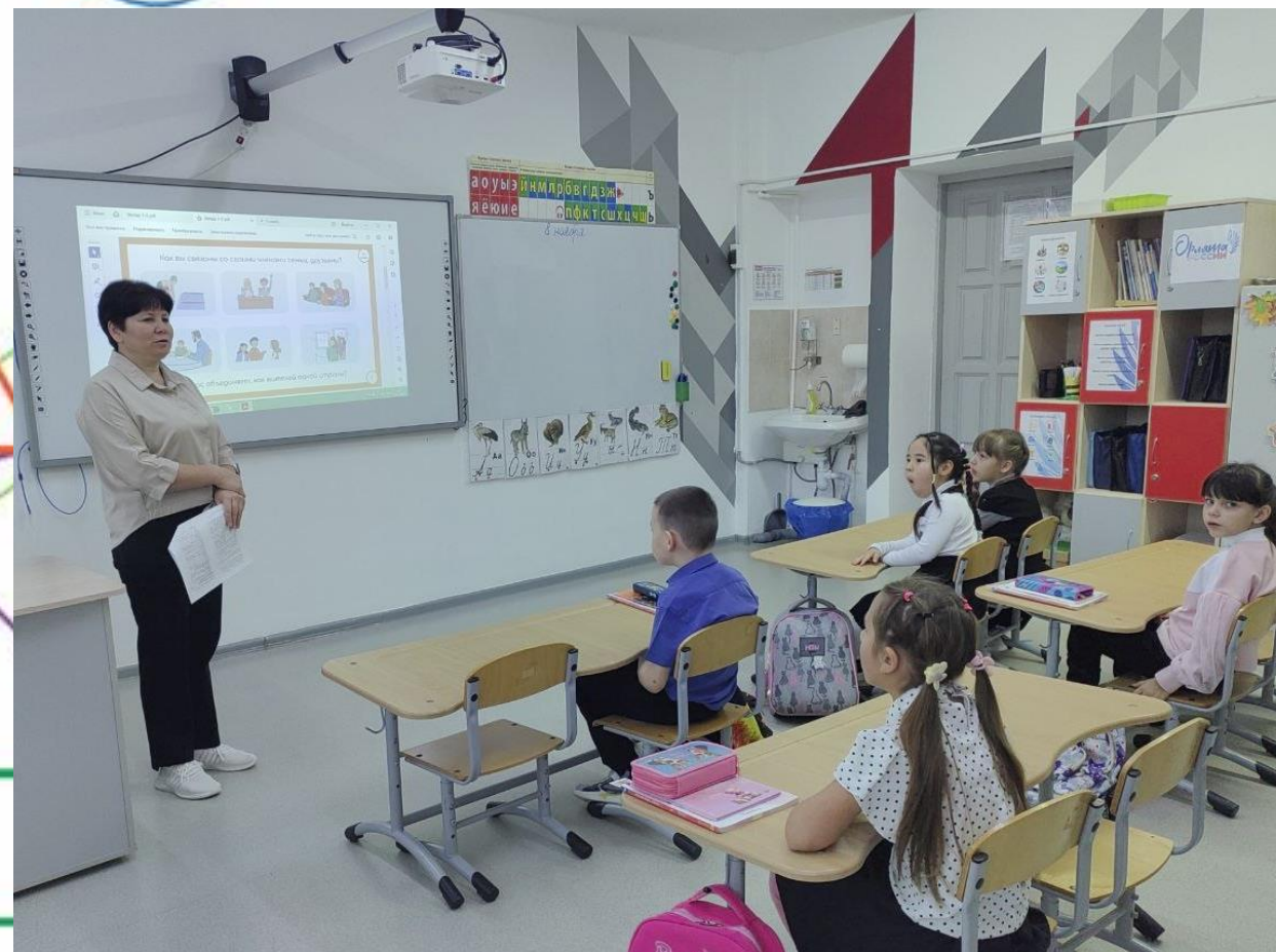
ТЕМАТИЧЕСКИЕ КЛАССНЫЕ ЧАСЫ «РАЗГОВОРЫ О ВАЖНОМ»