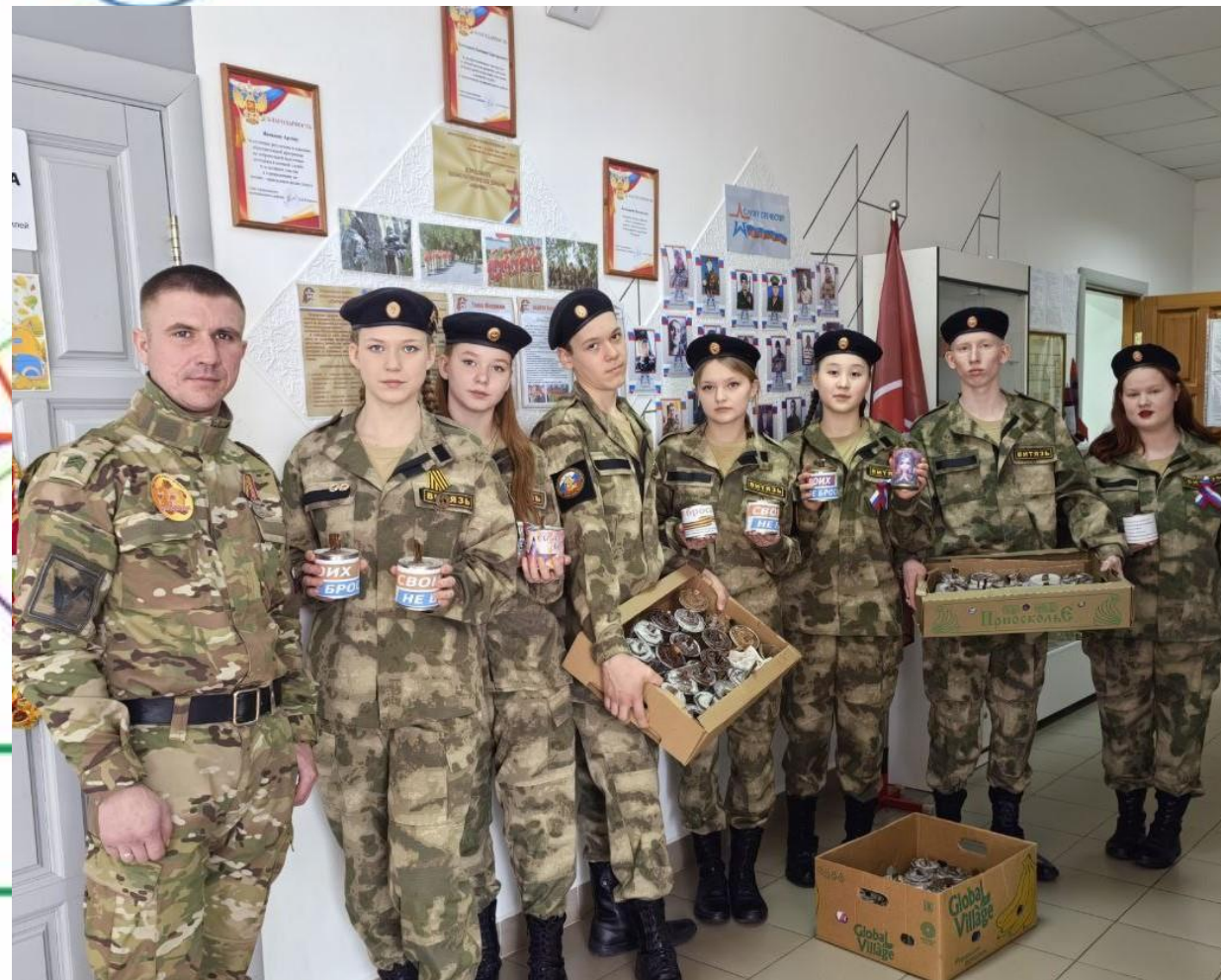
АКЦИЯ «ОКОПНАЯ СВЕЧА»