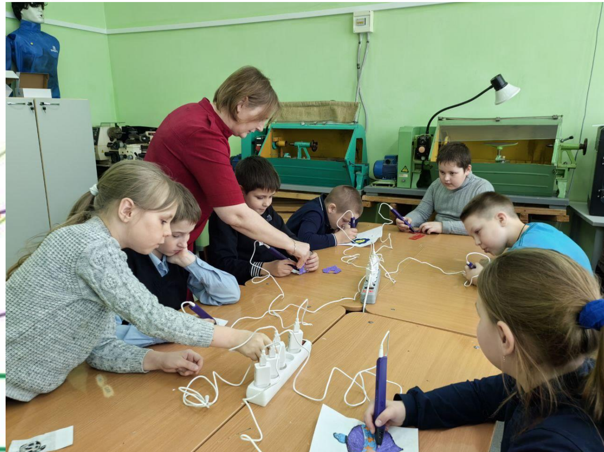
КРУЖОК 3D-МОДЕЛИРОВАНИЯ «СУНДУЧОК ИДЕЙ»