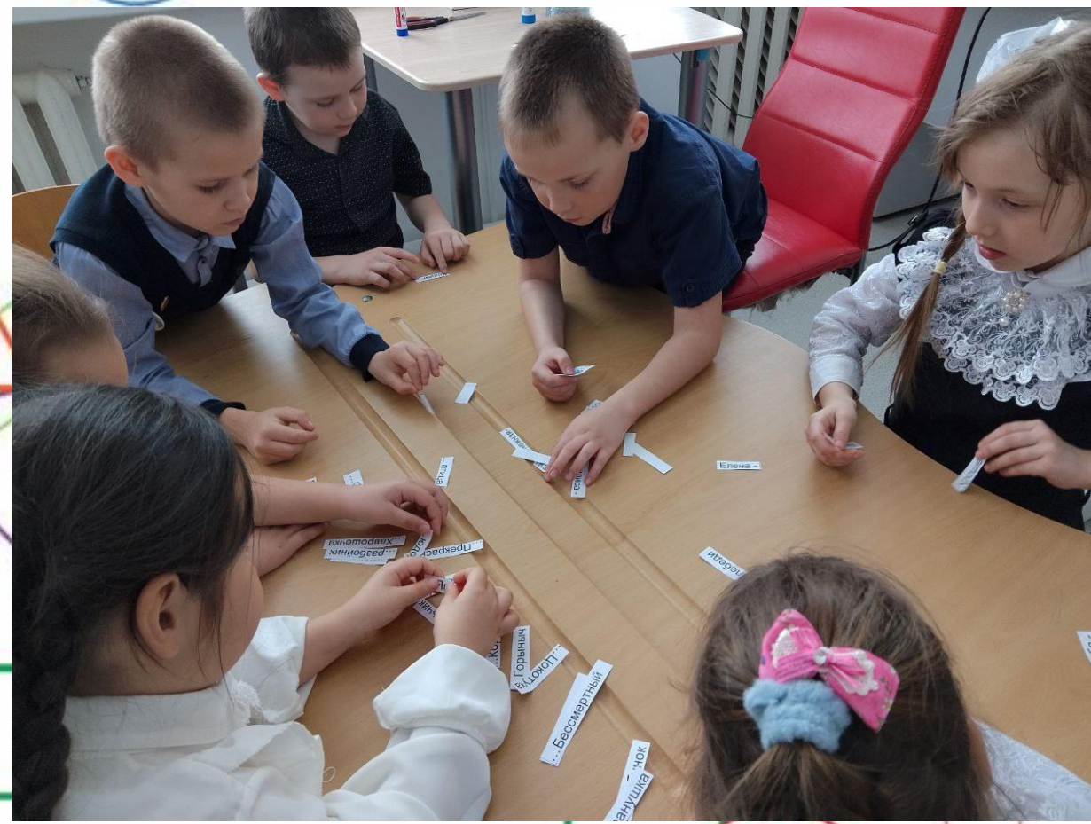
КРУЖОК «ЧИТАЙ, СЧИТАЙ, ДУМАЙ»