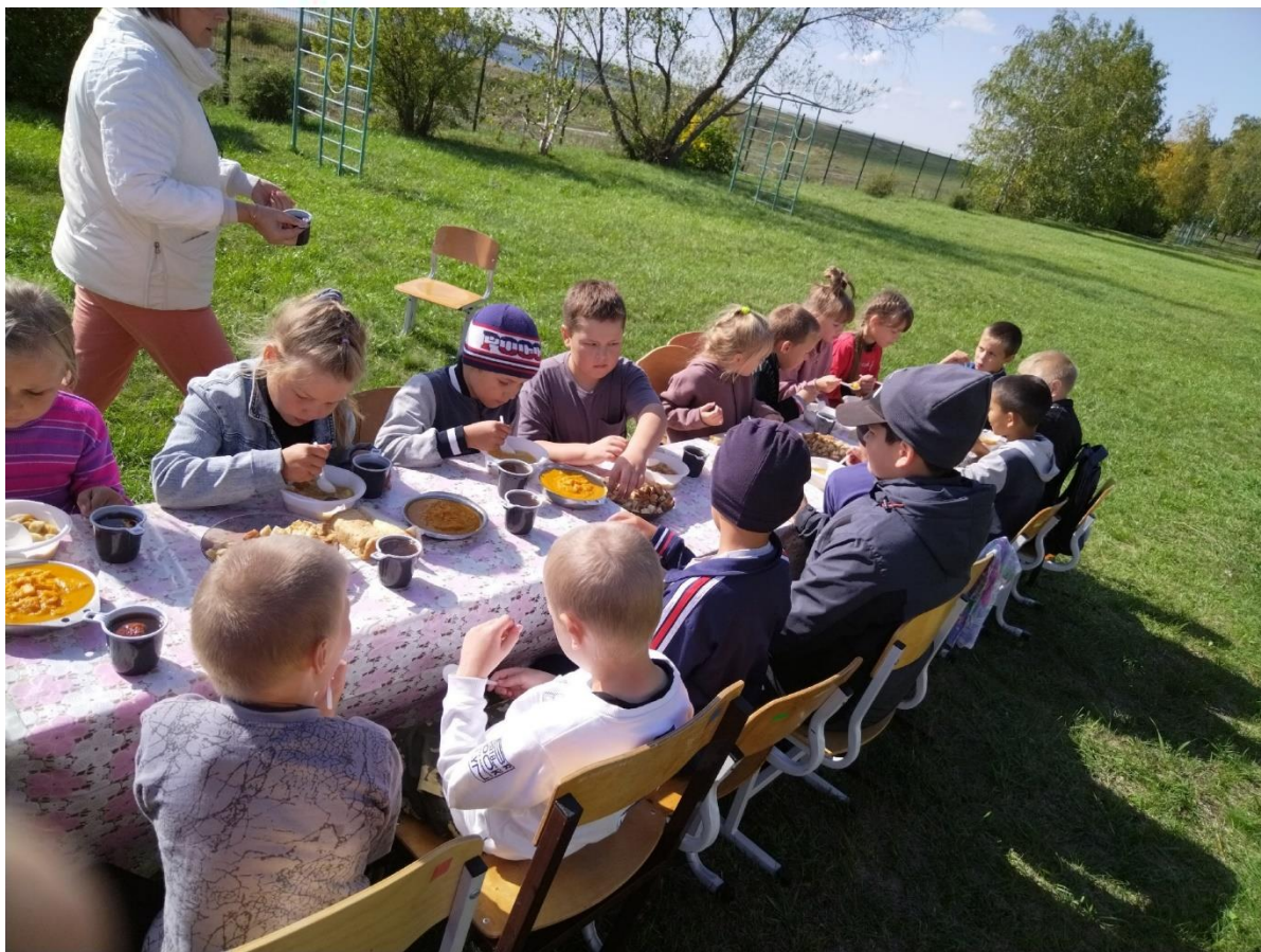
ДЕНЬ ЗДОРОВЬЯ - 2024