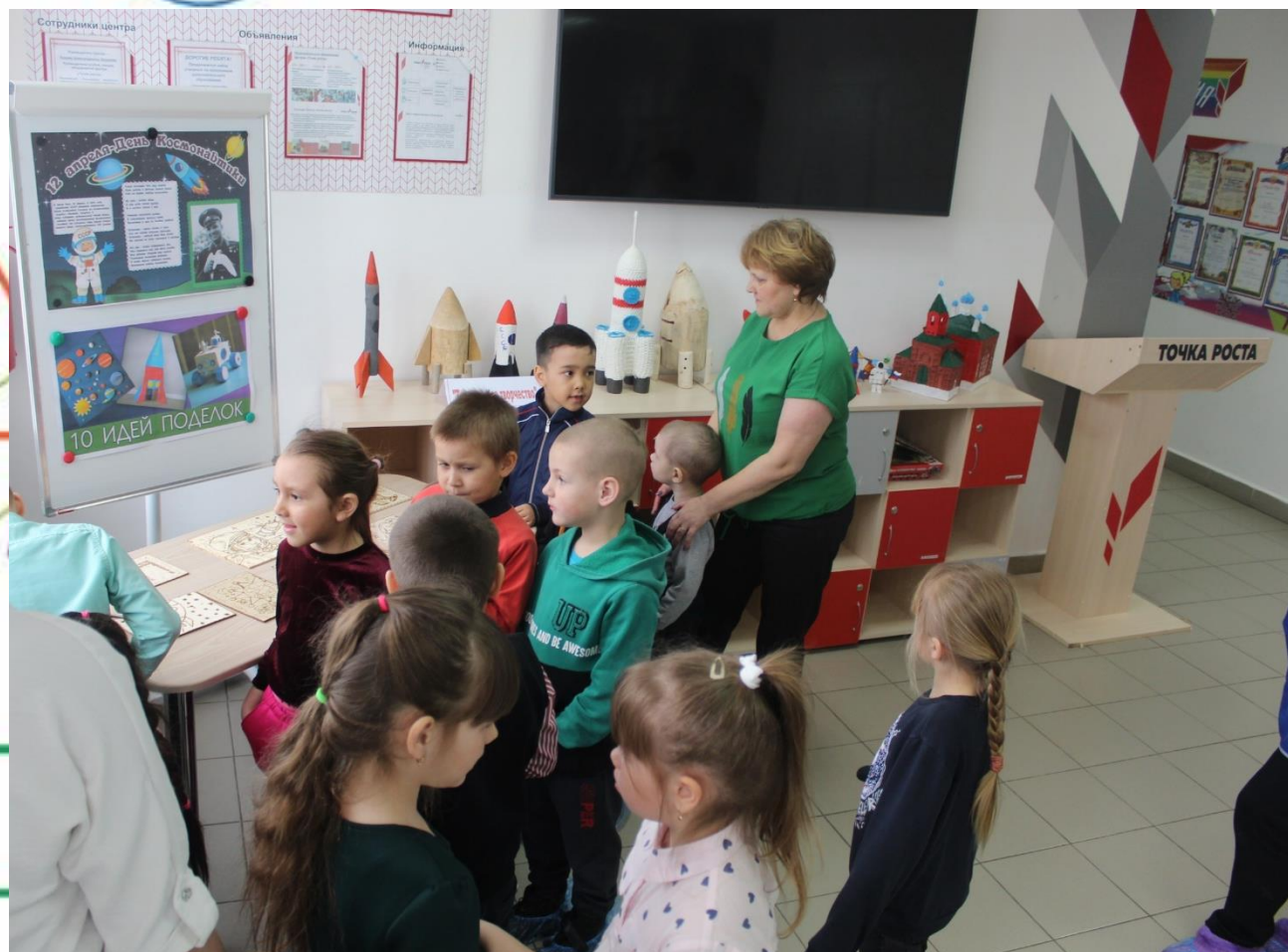
ВЫСТАВКА «ДЕНЬ КОСМОНАВТИКИ»