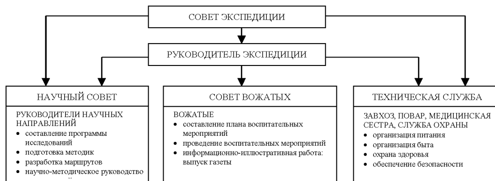
Рис. 1. Структура детской комплексной краеведческой экспедиции

Наиболее перспективным направлением любой образовательной системы является саморазвитие, когда появляется способность системы развивать себя [3, С. 15; 4]. Чтобы реализовать эту систему на практике, необходимо найти способы такого саморазвития, исходя из конкретных особенностей образовательного учреждения [5, 6, 7, 8].