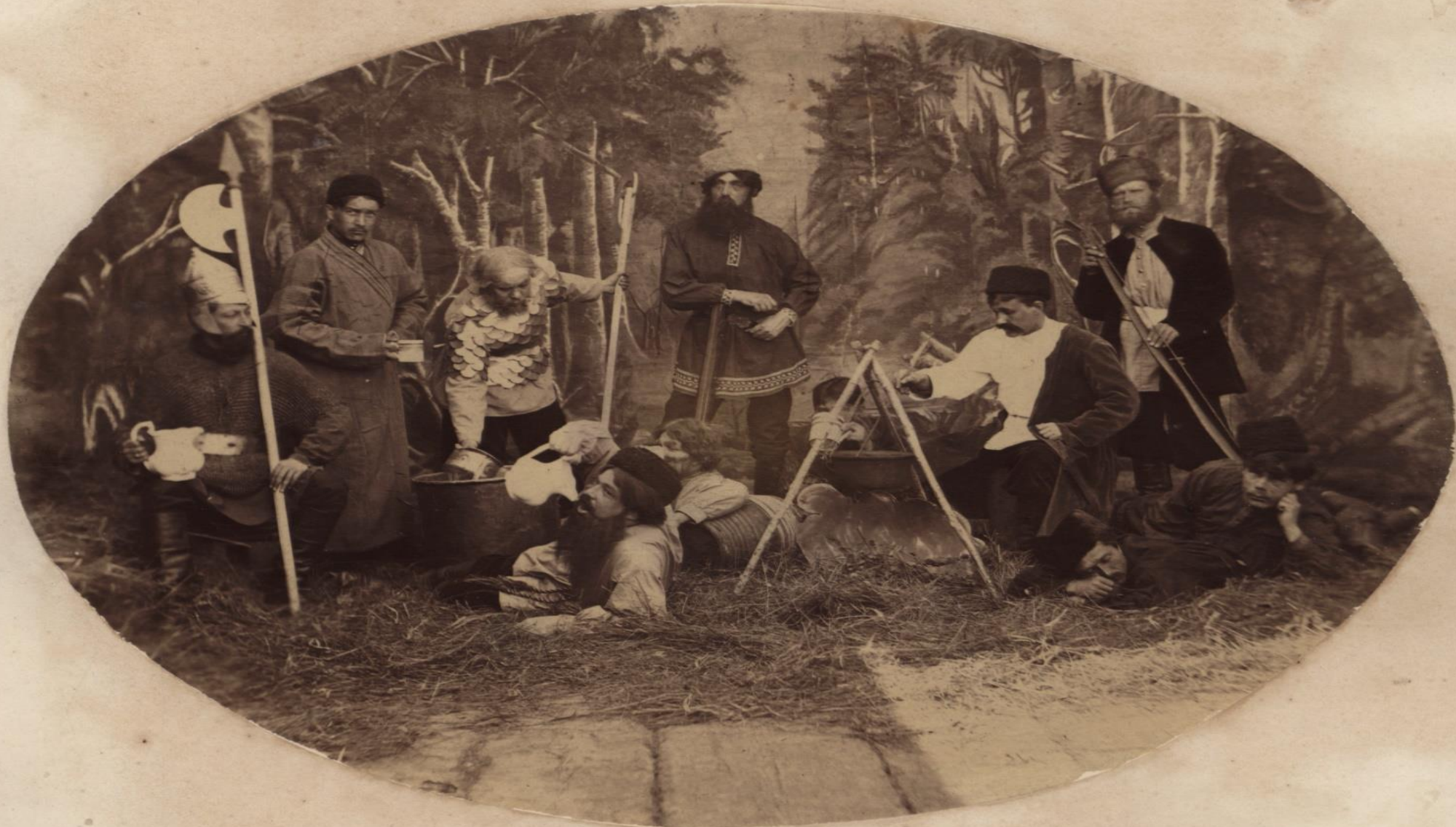
Дружина Ёрмака на Искерѣ.