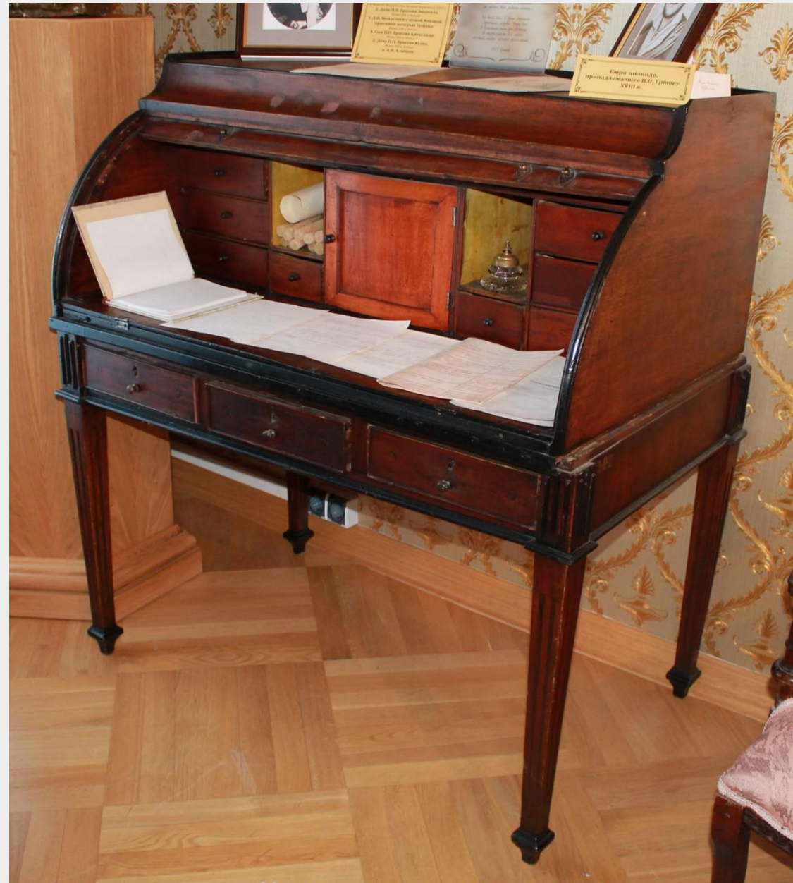
Бюро-конторка поэта П.П. Ершова. ТМ-8842