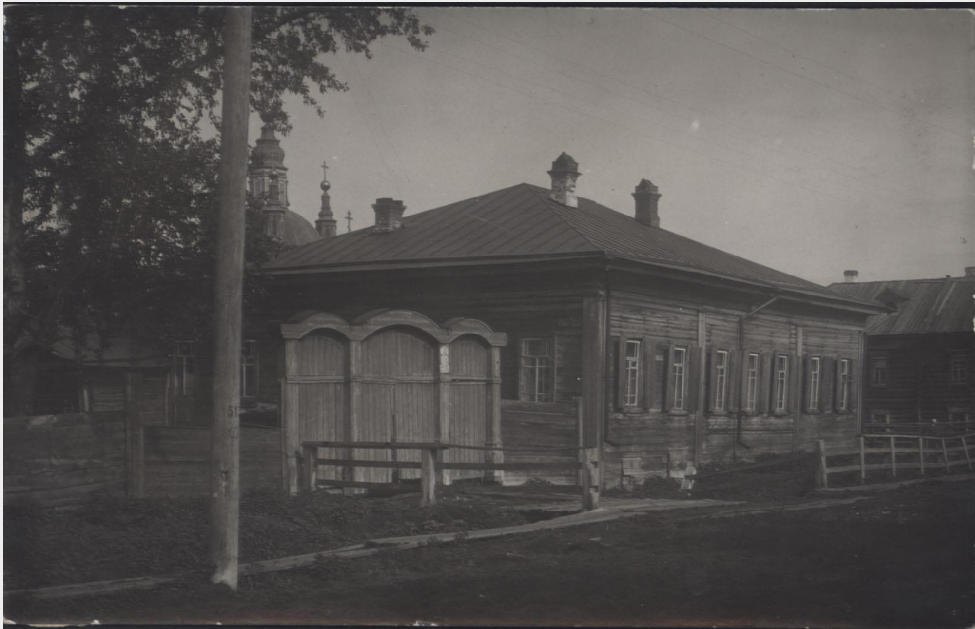
Дом, в котором жил в 1862-1869 гг. Ершов Петр Павлович. ТМ-17305