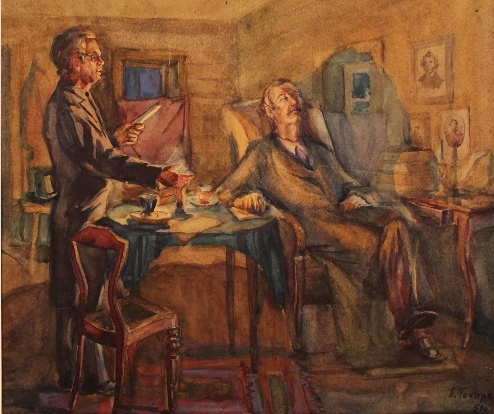
Токарев П.П. Рисунок "Ершов у больного Кюхельбекера" ТМ-16307