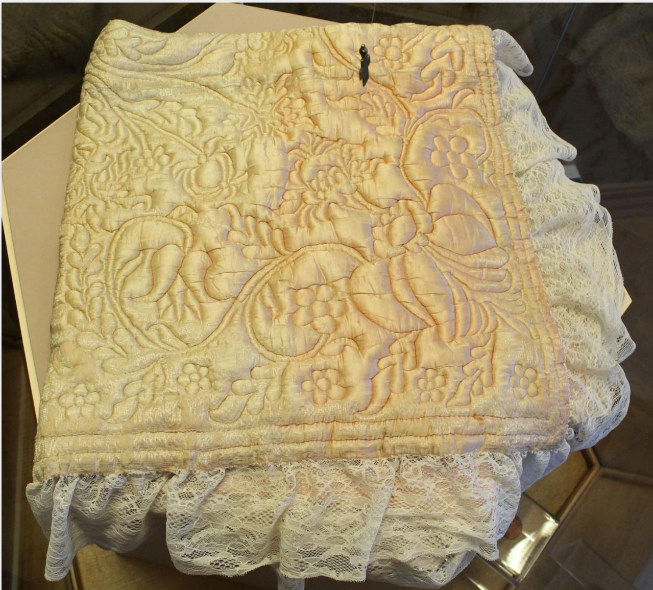
Крестильное одеяло П.П. Ершова. ТМ-8843