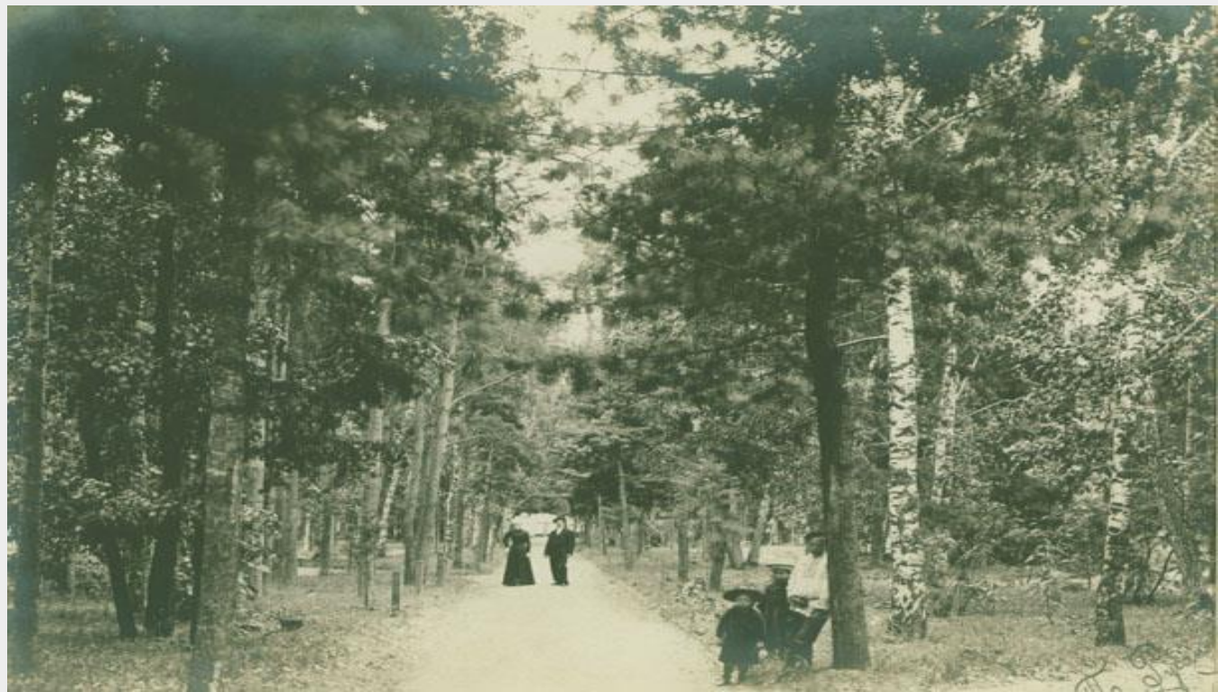
Сад Ермака. XIX в.