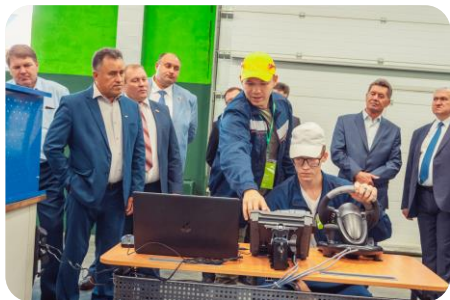
ГАПОУ ТО «Ишимский многопрофильный техникум»