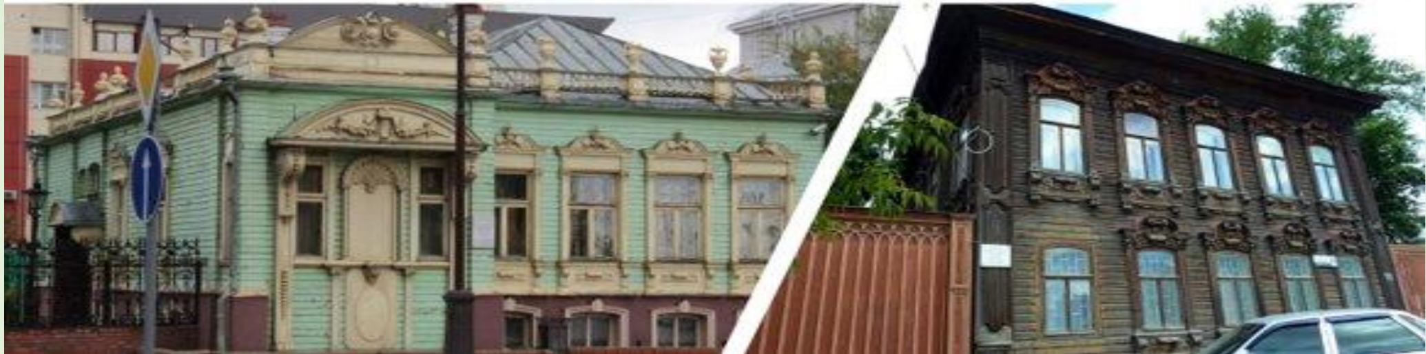
Отель Ремезов и исторический район города Тюмени